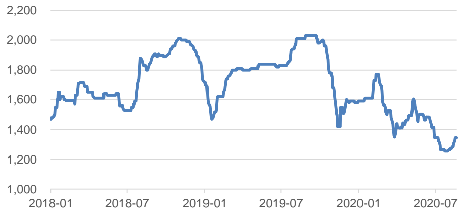
图 1: 2018年至今钼精矿价格走势 (元/吨度)